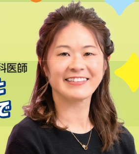
元サッカー日本女子代表 澤 穂希さん